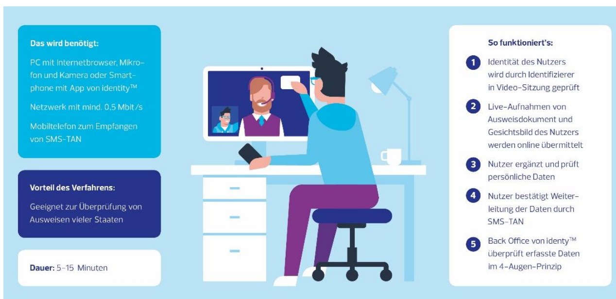
Online-Identifizierung mit Video-Ident

Lesen Sie hilfreiche Tipps zur Video-Identifizierung und klicken Sie auf Weiter . Sie werden auf die Identity™ Webseite weitergeleitet.